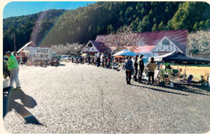
12月に行われたマルシェ