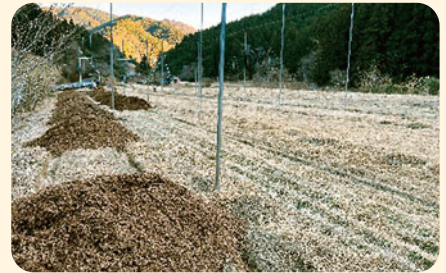
組合で出たチップを利用