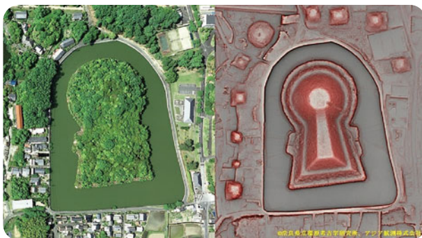
赤色立体図 立木は映らないので地形が分かりやすい

航空レーザー計測とは、航空機から発射されるレーザーを利用してその土地の地形やそこにある立木の材積を計測できる画期的な技術です。