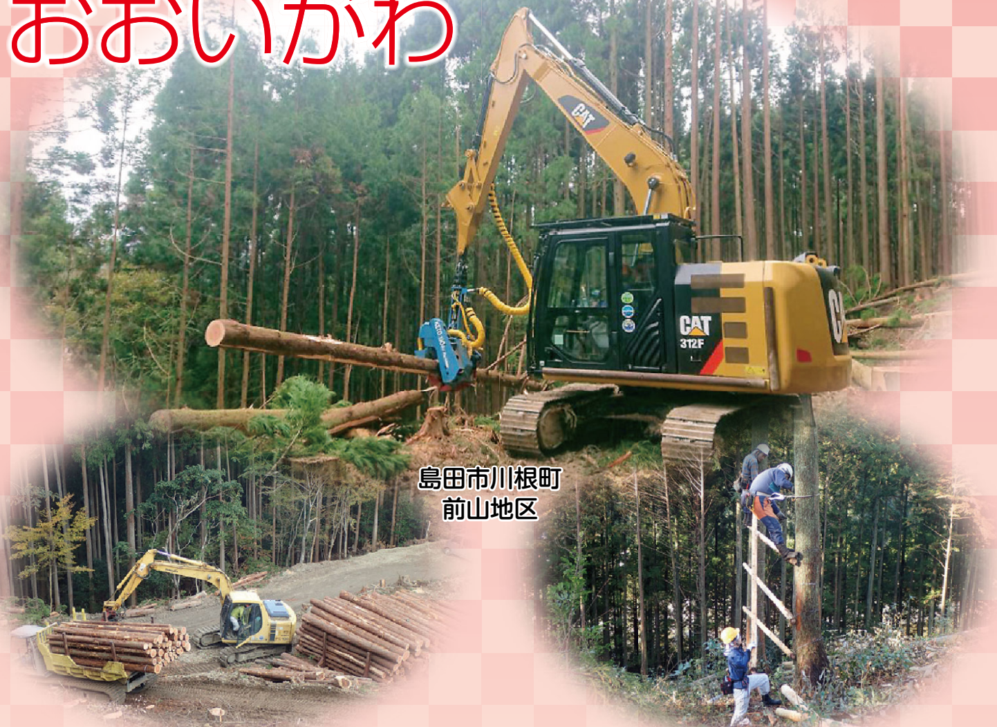
島田市川根町 前山地区