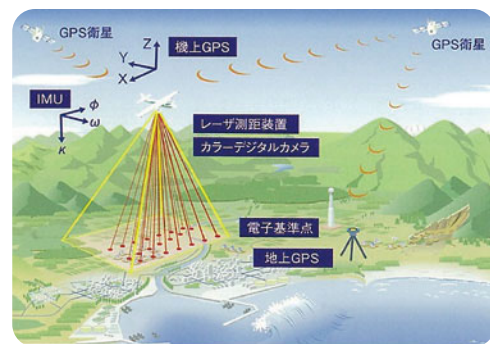
航空機をレーザーで計測する

これを利用することにより、上記写真のような正確な地形図を作ることができます。併せて、計測地の立木蓄積材積・本数などを知ることができます。